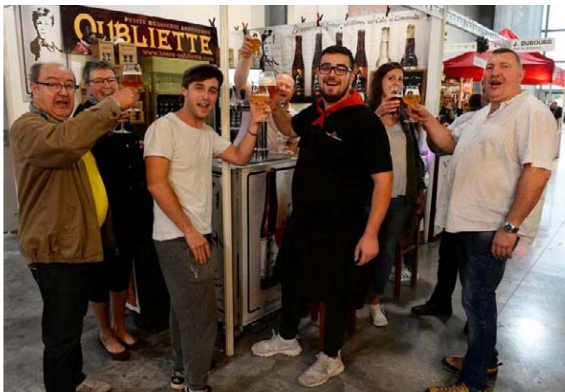
La bière, le précieux breuvage qui rassemble à la Foire de Châlons. Bernard Sivade

représenté Jean-Bernard Guyot. Du côté d'Hard'N Beer, dans le hall 1, la tendance est plus nette : « Je viens depuis trois ans et j'écoule en général 25 fûts durant la dizaine de jours », assure Christophe Havet, le patron. Soit 750 litres pour « un petit bar », comme dit le gérant.