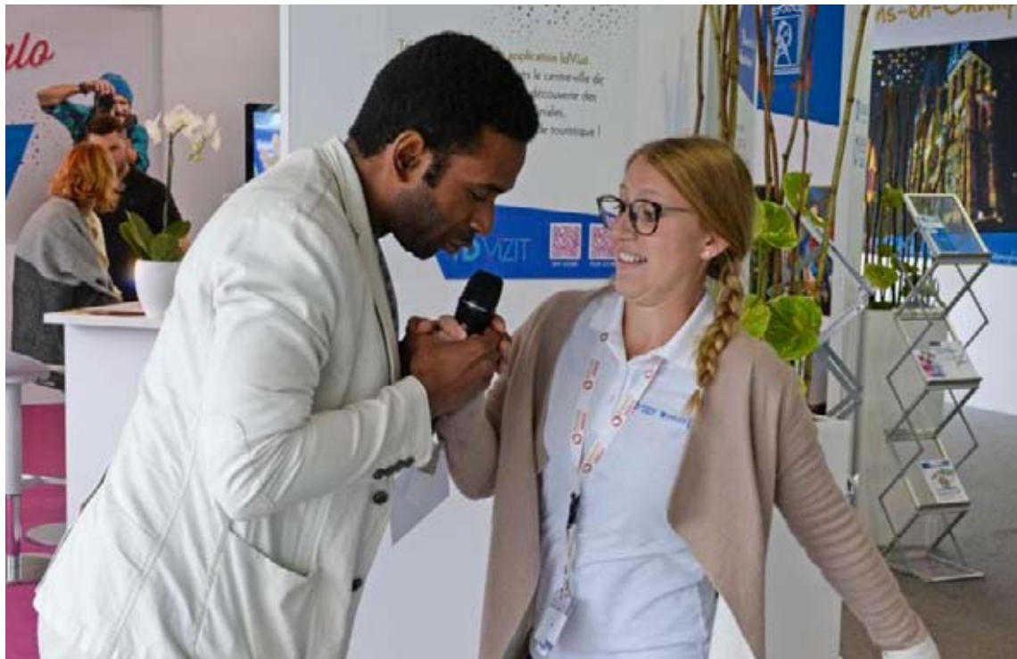
Pas si facile de saisir le précieux objet ! Illustration Bernard Sivade