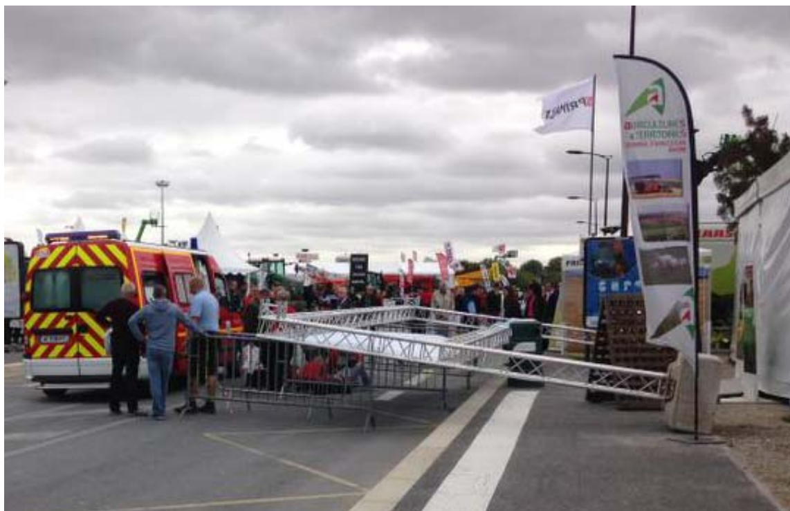
Les conséquences de la chute du panneau auraient pu être plus dramatiques. Alice Renard