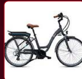
Les gagnants de ce jour seront désignés par tirage au sort ce soir.

Le règlement complet et détaillé est déposé en la SCP Marc TEMPLIER & Brice TEMPLIER, société civile et professionnelle d'huissiers de justice associés à Reims (Marne), 4, rue Condorcet, de même qu'un exemplaire des documents destinés au public. Le règlement peut être obtenu sur simple demande auprès du service Marketing de l'Union - 14, rue Edouard-Mignot - 51083 REIMS cedex. Pour jouer, remplir le bulletin ci-dessus le déposer dans l'urne située sur le stand de l'Union. Possibilité de déposer le bulletin de participation dans la boîte aux lettres de l'agence de Châlons-en-Champagne (18, rue du Lycée). Un tirage au sort aura lieu chaque soir de la Foire de Châlons-en-Champagne pour chaque jour de jeu. Un ultime tirage au sort aura lieu à l'issue du jeu pour désigner le gagnant de la super dotation. Aucun envoi par voie postale ne sera pris en compte. Ouvert à toute personne majeure domiciliée en France. Une participation par personne par journée de jeu. Retrouvez les noms des gagnants dans votre journal l'Union du dimanche 17 septembre 2017.