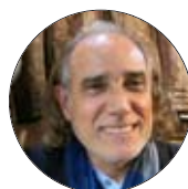
CLAUDE AMAR VENDÔME CRÉATIONS