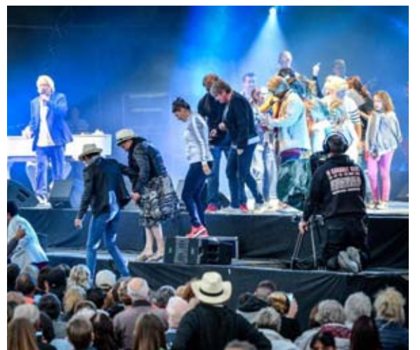
A deux reprises, le public est monté sur scène pour danser.