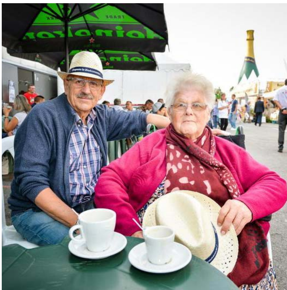
De l'ouverture des portes à 10 heures jusqu'à la fin du concert, tout est prévu pour que les aînés passent une belle journée. Aurélien Laudy

Le stand de la Caisse d'Épargne a fait jouer quelque 700 personnes sur sa borne lors de la journée des seniors de 2016 et distribué autant de stylos, en plus de près de 4,5 kilos de bonbons. Les clients d'un certain âge ne viennent pas souscrire à un nouveau livret bancaire mais plutôt porter aux oreilles des conseillers leurs réclamations du quotidien.