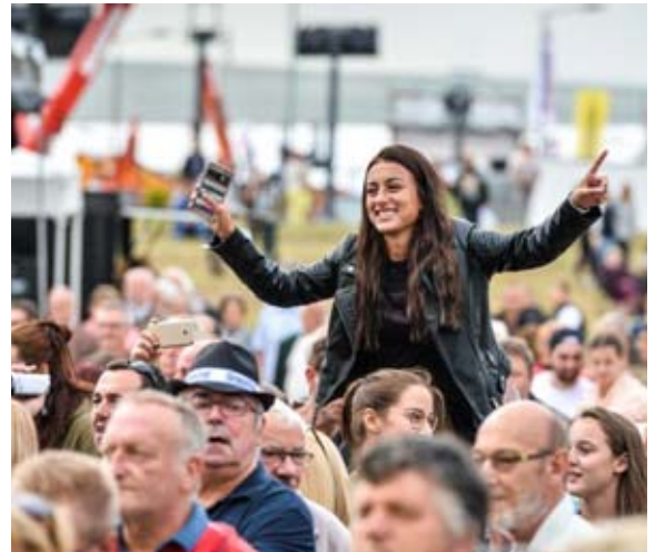
Plusieurs générations mélangées pour un concert au cours duquel les standards de la chanson française ont été interprétés.