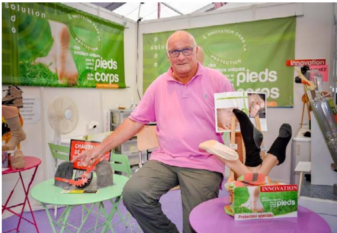
Les chaussettes conçues par Michel Chauveau soulagent les pieds de tous, sur terre comme dans l'espace. Aurélien Laudy

Saviez-vous que les astronautes ont mal aux pieds lorsqu'ils sont dans l'espace ? Contraints de les fixer sous des barres pour rester en position de travail, et résister à l'apesanteur, les appuis laissent des traces.