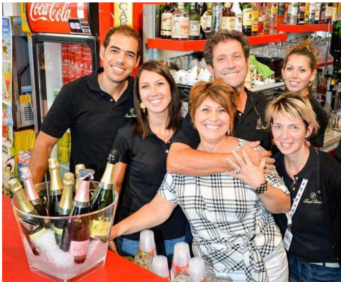
« Mets ton bras autour de moi, on verra qu'on est toujours amoureux ! » Le sourire de la famille Vendroux est son meilleur argument de vente. Aurélien Laudy

nato... Depuis des années, dès 8 heures, la tribu accueille les commerçants pour le petit noir du matin. Ils reviennent ensuite au fil de la journée, passant de la caféine au houblon, avant de s'installer pour de bon une fois leurs propres stands fermés. Et là, la fête « dure jusqu'à ce qu'on nous dise de fermer », sourient les tenanciers. Mais pourquoi les princes du nectar jaune fédèrent-ils autant ? « Je crois que les gens nous aiment bien... mais n'écrivez pas ça ! », rigole Flo-