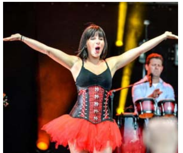
En plus des musiciens, deux danseuses aussi belles que complices ont accompagné Patrick Sébastien.