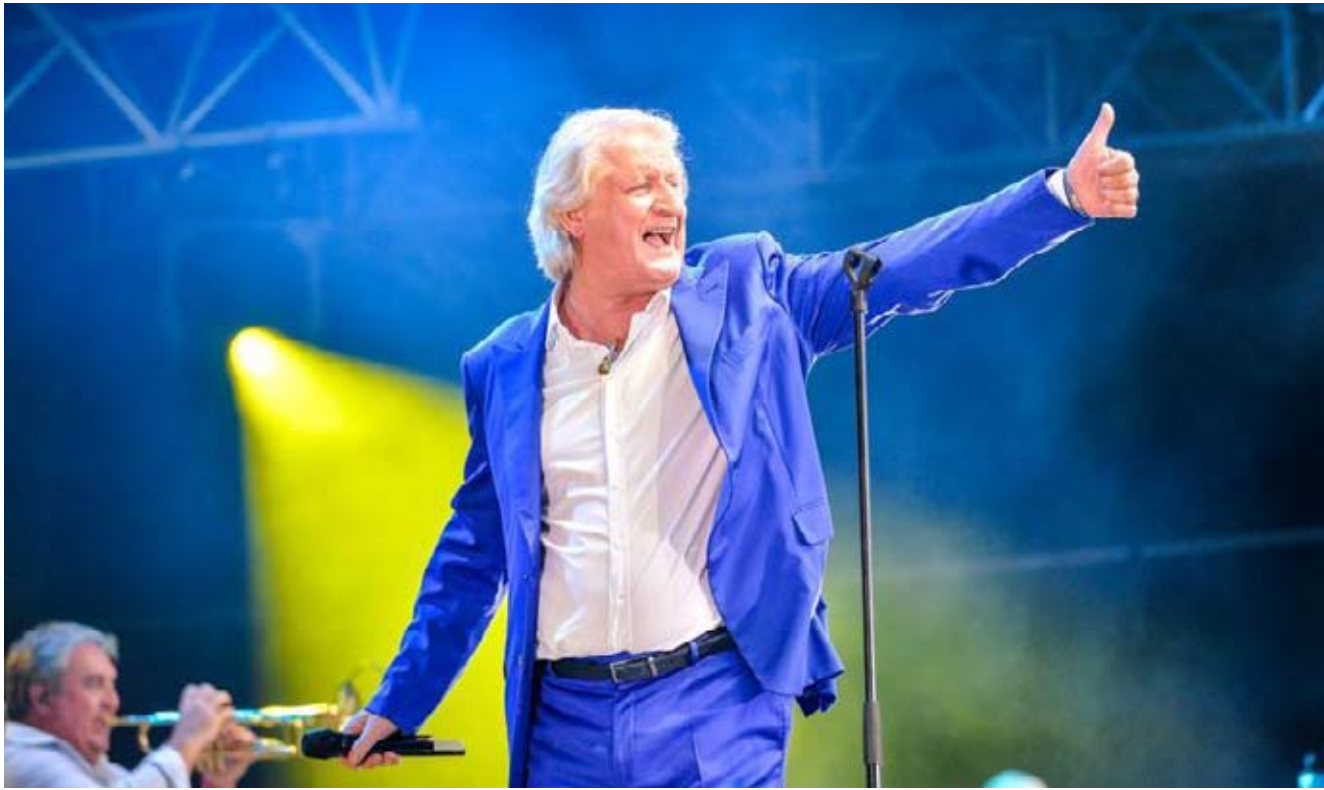
Deux heures de show en dépit d'une clavicule en convalescence, le roi de la scène a conquis le public châlonnais.