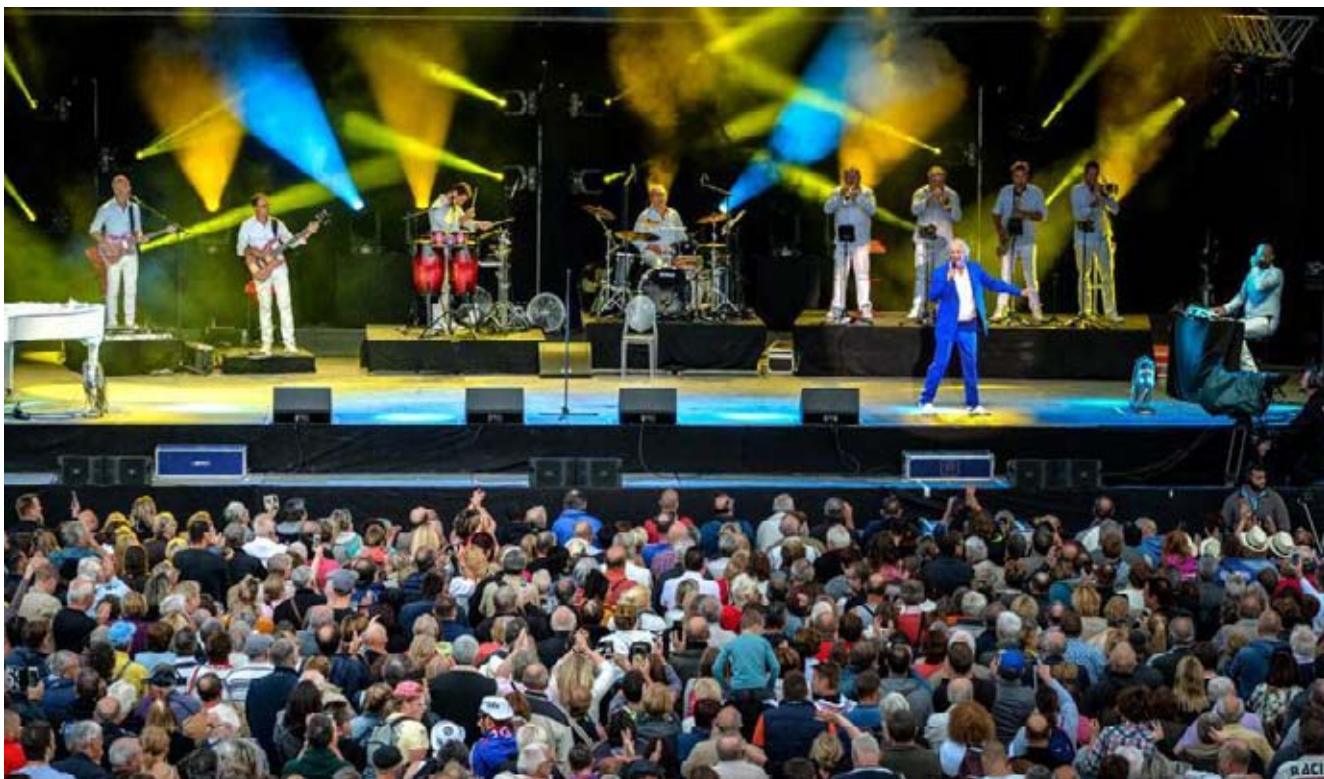
L'artiste déploie la même énergie sur scène que dans ses émissions, le public en redemande.