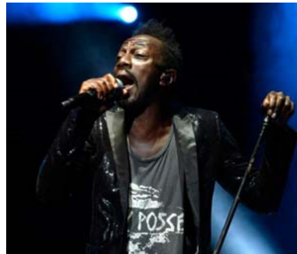
Déchaîné, Marco Prince n'a pas pris une ride : toujours aussi bondissant et envoûtant.