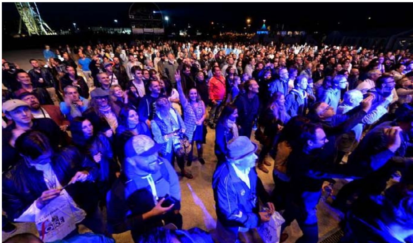
Comparé au 15 000 personnes pour Kids United, le public du soir faisait beaucoup plus épuré. Côté positif, les fans présents étaient plus que ravis de retrouver cette formation majeure du funk/rock des années 1990.