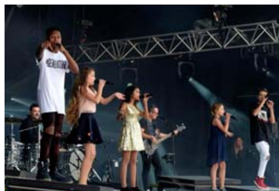
Plus de 15 000 personnes étaient présentes au concert des Kids United. C.L.

Il faut dire que la machine est bien rodée. Le show est millimétré, les phrases entre chaque chanson calibrées. Il y a un grand professionnalisme derrière tout ça. Dans le contenu, on retrouve tous les tubes du moments revisités avec les voix angéliques des Kids United. Mais pas que : « Ce qui est agréable, c'est qu'ils reprennent des titres plus anciens pour les plus vieux comme nous », lâche une mère alors que sa petite a des étoiles dans les yeux. Pas loupé, quelques secondes plus tard retentit Imagine des Beatles. L'occasion d'une communion entre deux géné-