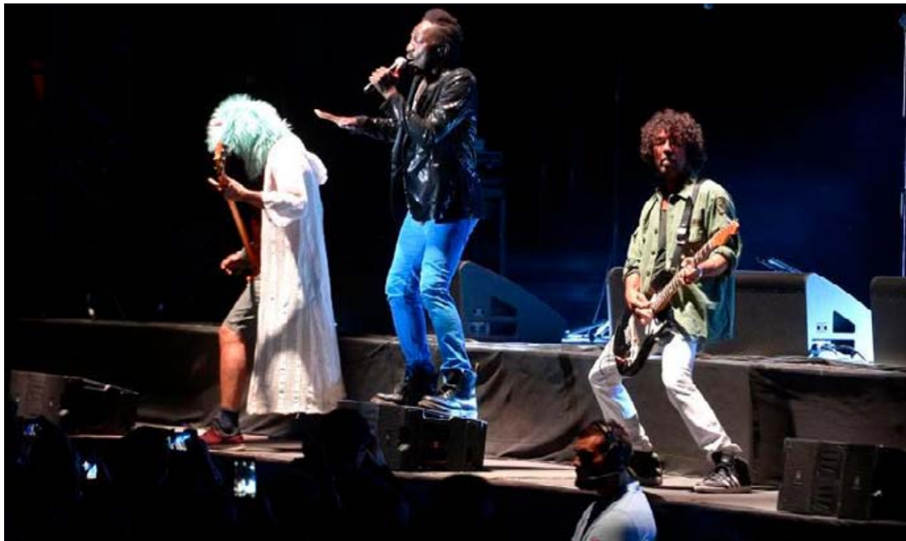
De retour sur scène après plusieurs années d'absence, la FFF n'a rien perdu de sa fougue et de sa superbe.