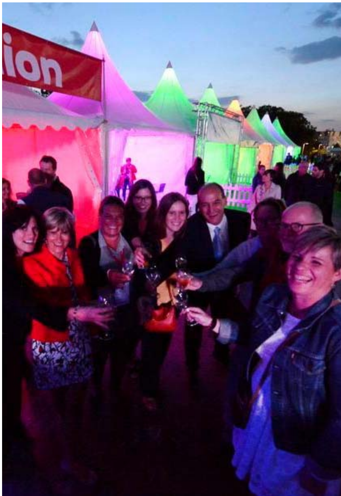
Les cottages sont loués pour la Foire par les entreprises locales qui en profitent pour inviter leurs clients.