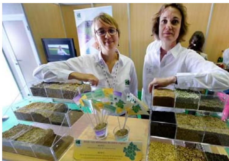
L'ingénieure et la mutiplicatrice de semences sont fières de leur filière compétitive. Christian Lantenais

C'est le nombre de producteurs sur les neuf départements de la FNAMS Nord-Est. Ces multiplicateurs de semences cultivent 58 900 hectares