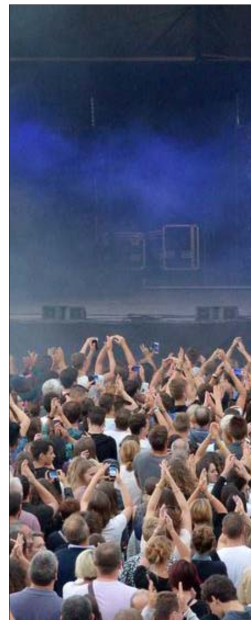
Pendant une grosse heure et quart de concert, The Avenner a motivé la foule au micro.