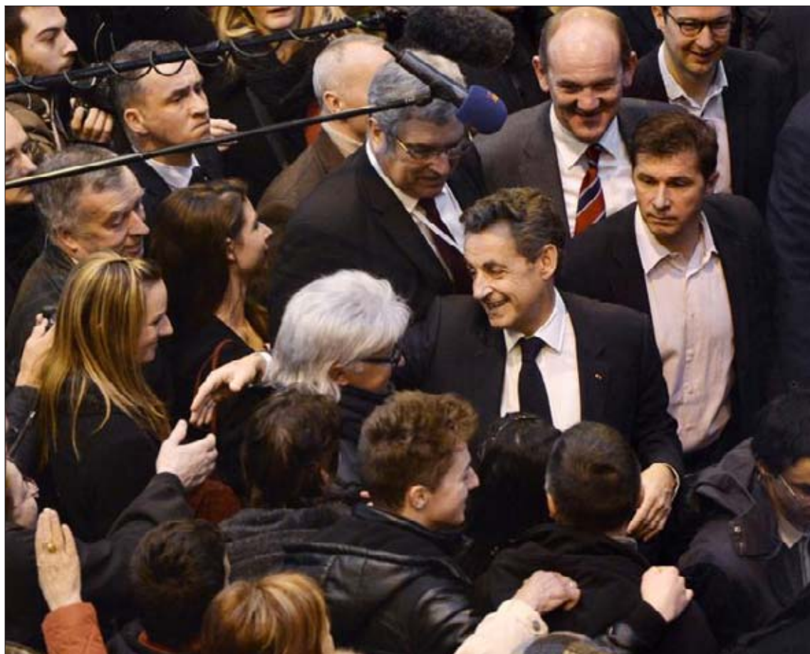
Nicolas Sarkozy est attendu au Capitole aujourd'hui.

Côté organisation, le parcours est plus ou moins bien ficelé. Certains parcourent les stands au gré de leur inspiration mais la plupart ont un emploi du temps mil-