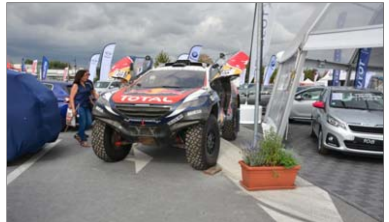
L'engin, comme sorti d'un film, développe 500 cv.