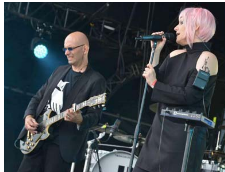
Les Rémois de Nanokill ont assuré la première partie du show.