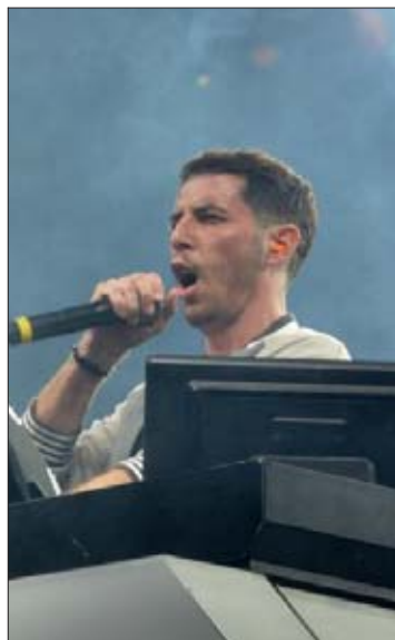
The Avenner a motivé la foule au micro.