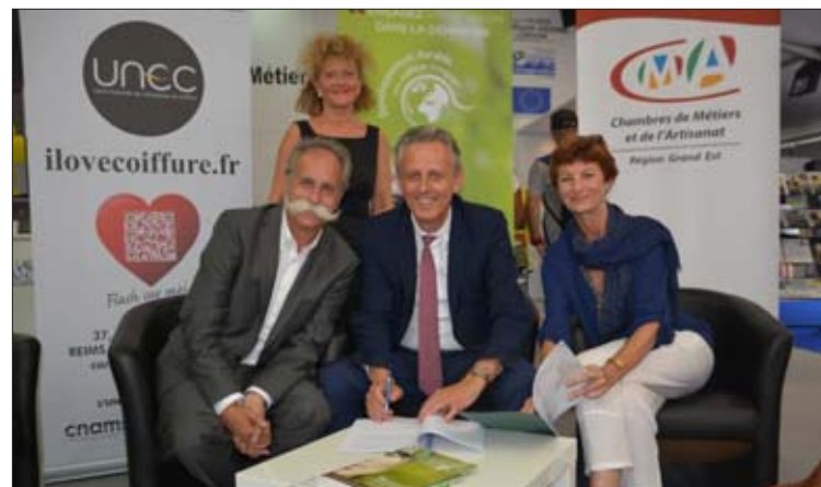
Le label est soutenu par l'Agence de l'environnement et de la maîtrise de l'énergie.

Carrefour de stars avec Champagne FM ce mardi 30 août, à 19 heures.