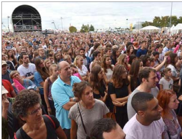
Dès l'arrivée de The Shoes, la foule a considérablement augmenté.