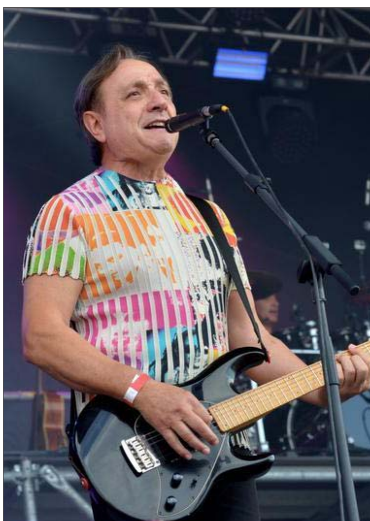
Du bon son du côté d'Images.

Près de 3 000 personnes ont assisté, hier, au show regroupant les artistes de toutes les générations. Un plateau éclectique.