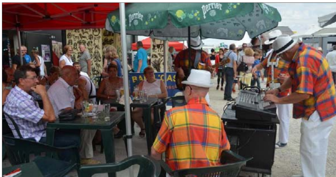
Un petit air de musique bienvenu dans les allées de la foire.