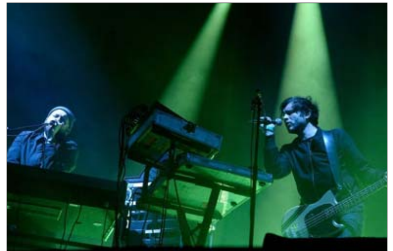
La soirée de L'union commencera à 18 heures.

direct qui vous plongera au milieu de la foule mais aussi dans les couloirs de l'événement. Sur tous les réseaux (Twitter, Snapchat, Instagram), vous pourrez vous ambienter entre les coussins de votre canapé et profiter des moments insolites mais surtout de chaque décibel de ces deux concerts qui s'annoncent ébouriffants.