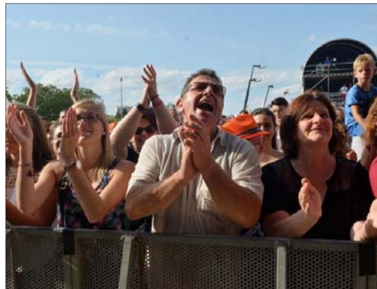
Certains fans sont arrivés tôt pour être au pied de la scène.