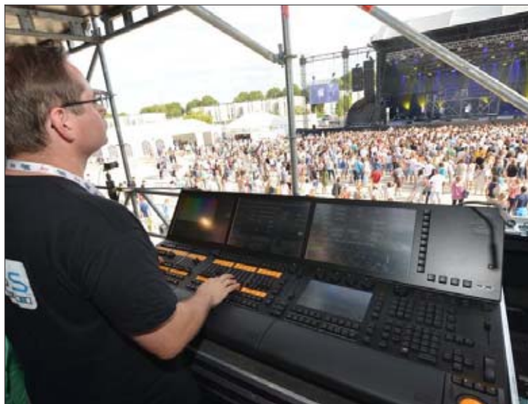
La régie est assurée par les professionnels de Tekliss.