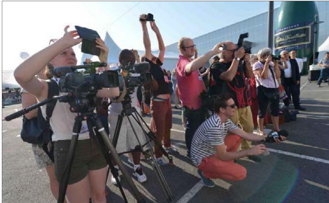
Toute la presse était réunie ce dimanche pour le passage de Philippe Richert, président de la nouvelle région Grand Est

Représentants de l'Hebdo du vendredi (détenu à 33 % par l'UCIA, organisatrice de la Foire), News mag, RCF (qui enregistre directement depuis son stand) ToutChâlons.com, Campagne TV France Bleu, la Marne Agricole ainsi que France 3, le Sillon Belge (presse professionnelle) ou encore Le Parisien – Aujourd'hui en France. L'union a également une équipe dédiée qui travaille chaque jour pour sortir ce supplément depuis l'agence délocalisée, un « pool » où chaque titre a « ses » locaux et surtout son matériel (ordinateurs, imprim-