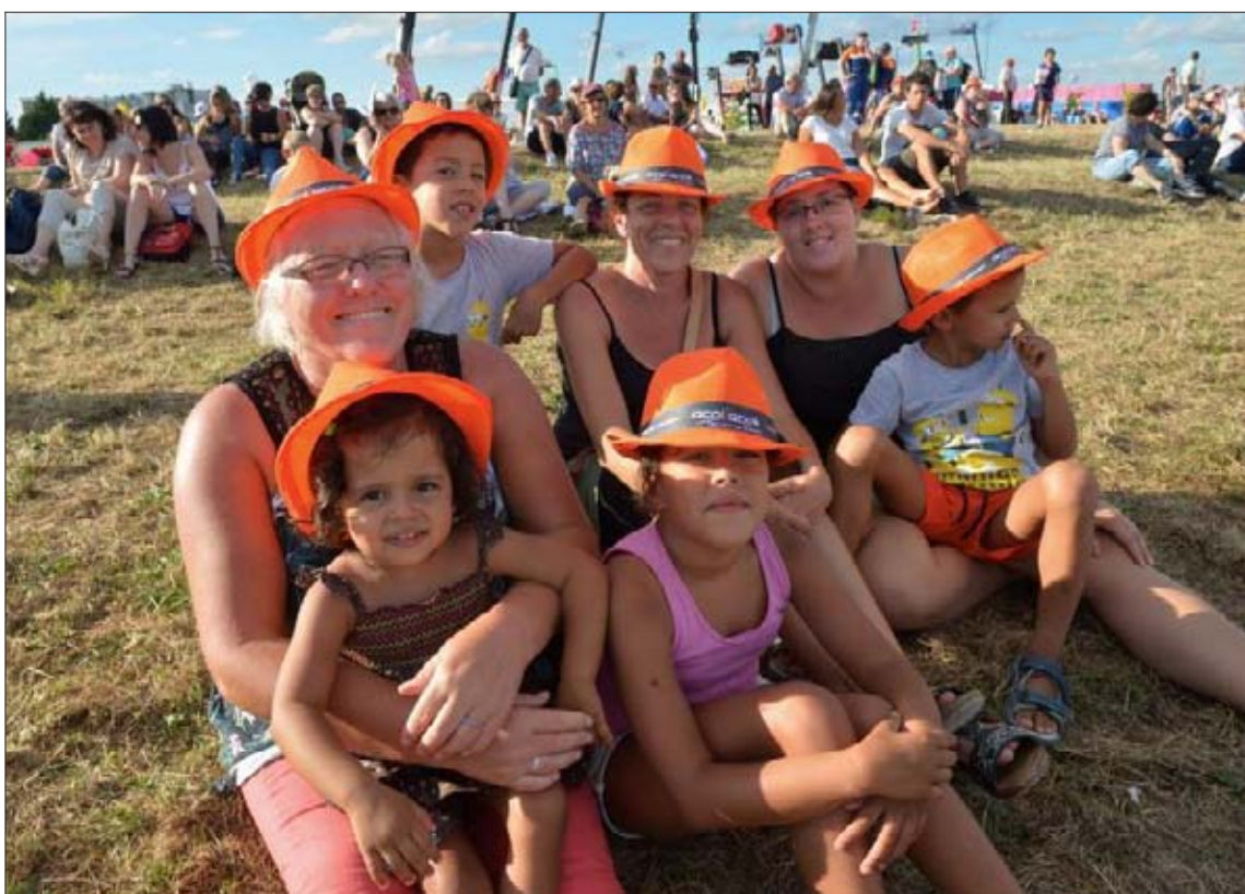
Cette famille rémoise a apprécié le concert anniversaire proposé hier.

Avant la rentrée des classes cette semaine, la Foire avait un air de fête ce week-end. De quoi recharger les batteries avant le début du mois de septembre.