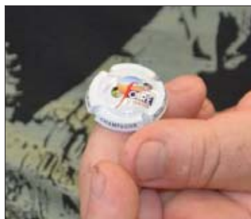
Une capsule coûte 2 € pièce.