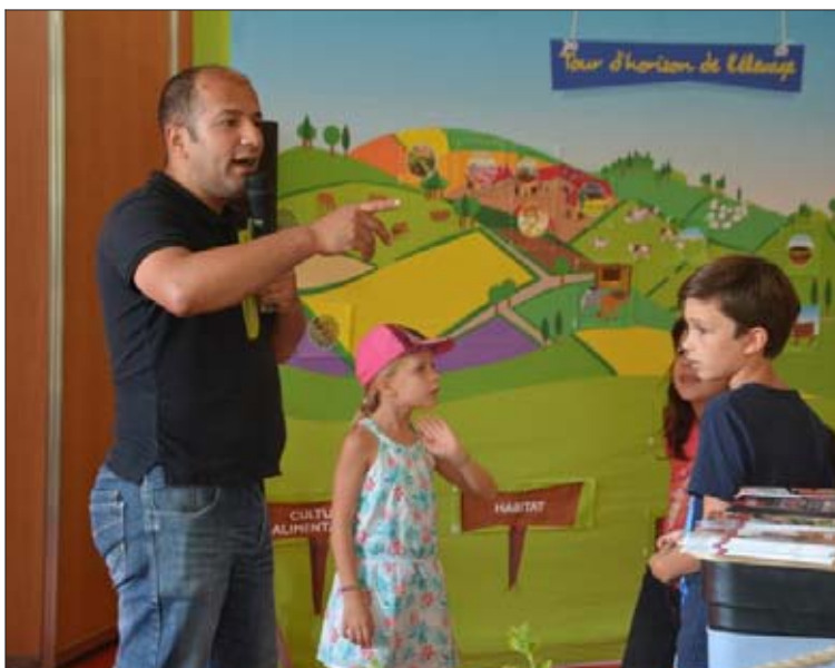
Quiz sur la viande pour les enfants à la ferme.